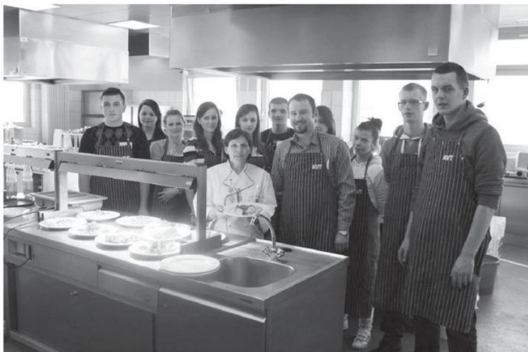
Uczniowie ZS nr 4 im. Ziemi Podlaskiej na stażu w Centrum Szkoleniowym Teltow (AVT) w Niemczech

Pieśni i Tańca „Podlaskie Kukułki”, który propaguje kulturę ludową Podlasia w kraju i za granicą. Działają sekcje piłki siatkowej chłopców i dziewcząt oraz sekcje tenisa stołowego. Uczniowie uczą się również współżycia społecznego poprzez aktywny udział w Samorządzie Uczniowskim. Młodzież rozwija swoje zdolności w poczuciu bezpieczeństwa i szacunku dla własnej osoby. W ten sposób szkoła przyczynia się do budowania kapitału ludzkiego, który służy potrzebom regionu i całego społeczeństwa.