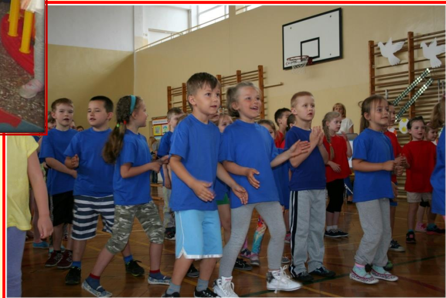
Spartakiada „Razem weselej”