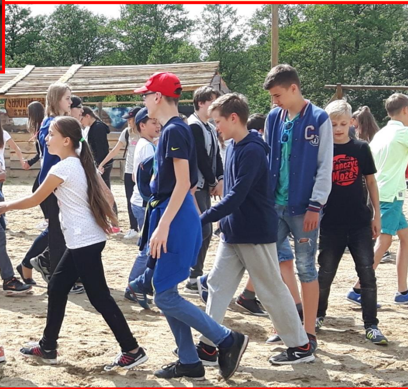
Uczniowie na wycieczce