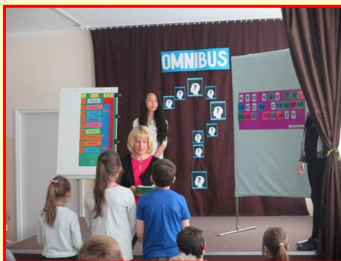
Konkurs wiedzy „Omnibus”