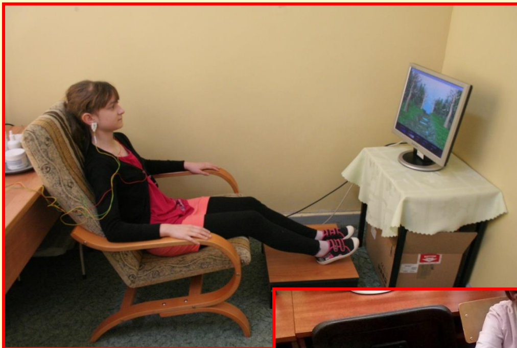
Terapia EEG Biofeedback