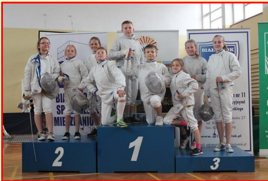
Ogólnopolski Turniej „Pierwszy Krok Szermierczy”