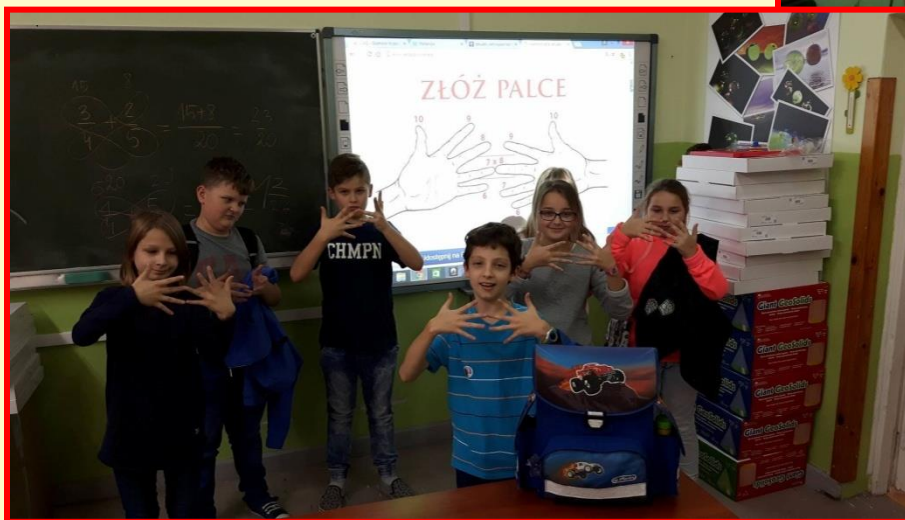
Szkoła Podstawowa Nr 11 z Oddziałami Integracyjnymi im. K. Makuszyńskiego w Białymstoku