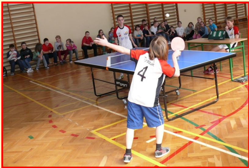
Turniej Tenisa Stołowego