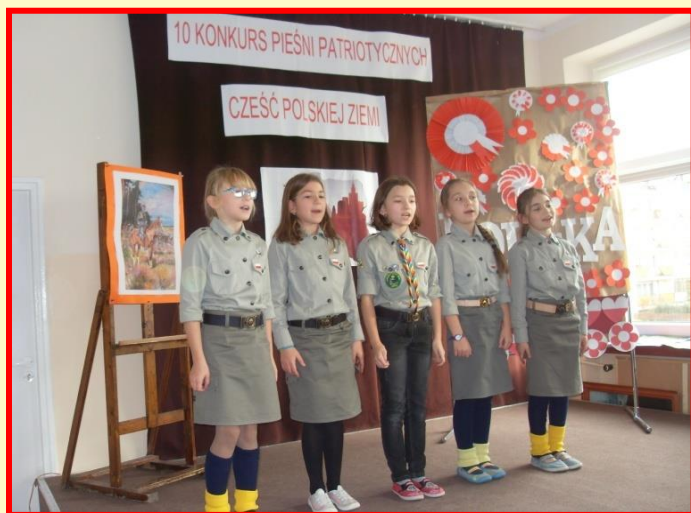
Konkurs pieśni patriotycznych