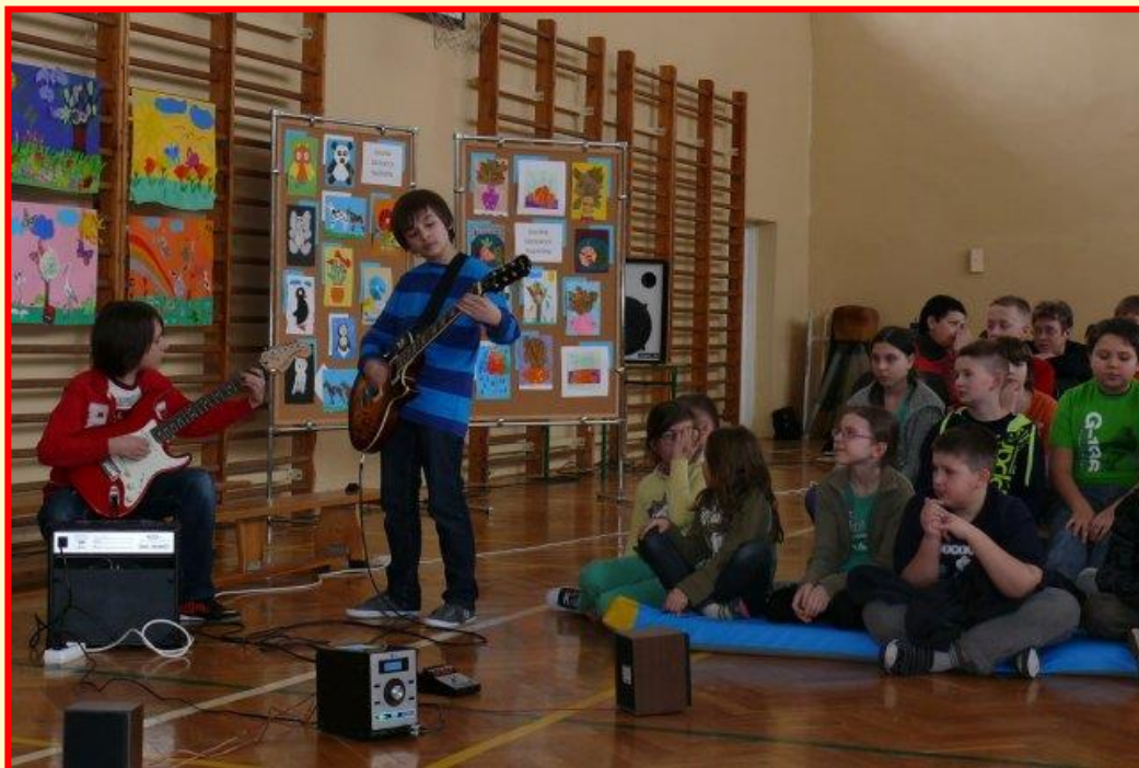
Szkolny Turniej Talentów